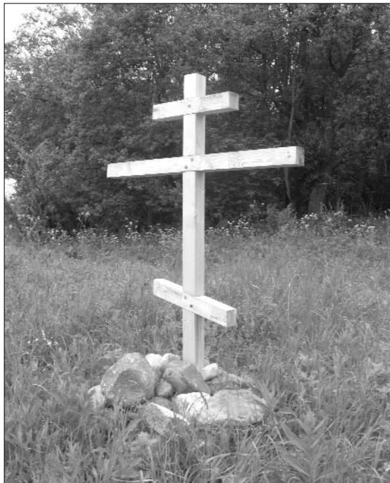
Деревянный крест, установленный в 2011 году рядом с местом бывшего Богородицерождественского храма

силием Скворцовым была составлена метрика о храме, из которой можно узнать, что церковь была одноэтажная, построенная «разносторонним крестом»: длина 22,75 аршина (16 метров), ширина «настоящей церкви» 7,75 аршин (5,5 метров), ширина трапезной 11 аршин (7,8 метров). Располагалась она «на пригорке, близ коего на юг в овраге есть два ключа, из которых образовалась речка, именуемая Болденка».