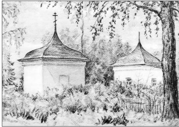
Часовня в Полевшине. Рисунок С. М. Чехова. Из книги «По чеховским местам»

Часовня при Казанской церкви в Малинках не являлась каким-то примечательным строением, поэтому упоминается лишь в немногочисленных редких архивных документах. Первый из них относится к 1862 году, это сводная ведомость о церквях, в которой представлены лишь статистические сведения: «Казанская в Малинках, одноклирная, каменная. Одна часовня каменная». Вполне возможно, что полевшинская часовня даже не имела посвящения, но ни подтвердить, ни опровергнуть это пока не удалось. Следующий раз она упоминается в страховой карточке Казанской церкви в 1910 году: «Часовня каменная. Оценочная сумма 50 рублей». Причем в том же документе стоявшая рядом каменная сторожка оценена в 65 рублей.