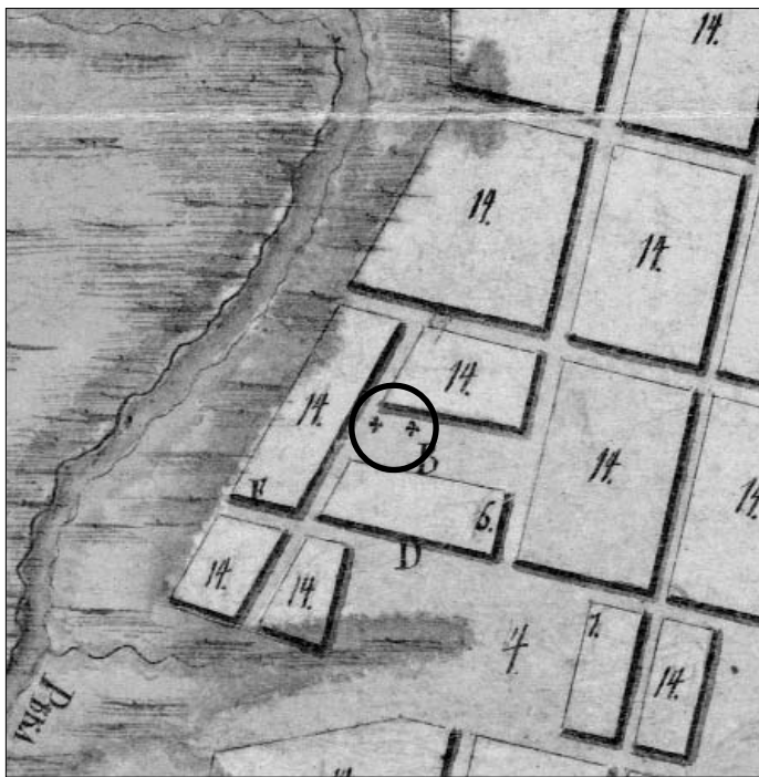
Фрагмент плана Воскресенска начала XIX века с отметками деревянного (слева) и строящегося рядом каменного храма.

Во время правления императрицы Екатерины II в стране происходили большие административные перемены – в 1781 году бывшее село Вознесенское преобразовали в город Воскресенск, который сначала стал центром одноименного уезда, а через 15 лет, после очередной реформы, – заштатным городом Звенигородского уезда. В то время в нем проживало около тысячи человек и, судя по всему, старая деревянная церковь перестала удовлетворять потребностям прихожан – городской статус поселения