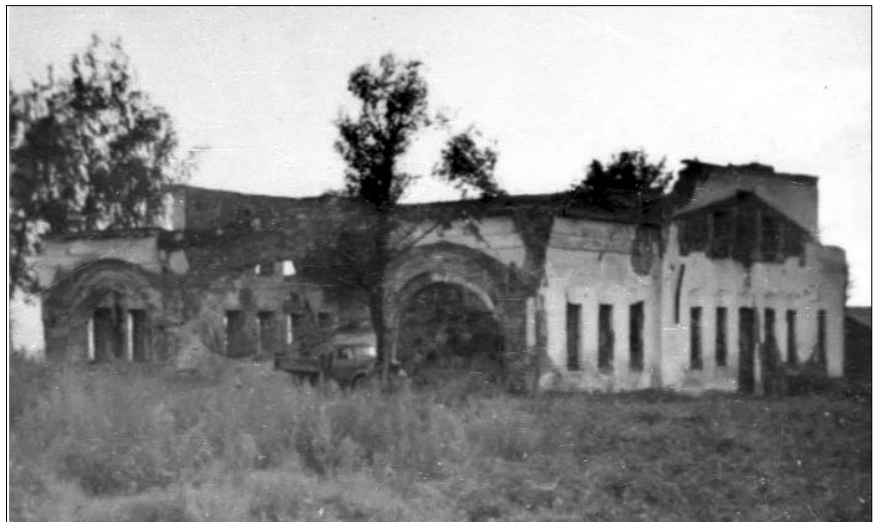
Руины храма Вознесения Господня в Истре. 1950-е годы.

Дальнейшая судьба Вознесенского храма прослеживается по публикациям в районной газете (тогда она называлась «Истринская стройка»). Сначала в ней напечатали краткую заметку: «В связи с закрытием Истринского собора Горсовет предлагает всем заинтересованным гражданам перенести зарегистрированные могилы из ограды собора на Истринское кладбище при горбольнице в десятидневный срок до 25 ноября 1934 года». По воспоминаниям жителей города, реально почти никому не удалось перенести захоронения. Но власти спешили. В феврале следующего года та же газета писала: «В Истре есть для клуба великолепное здание, когда-