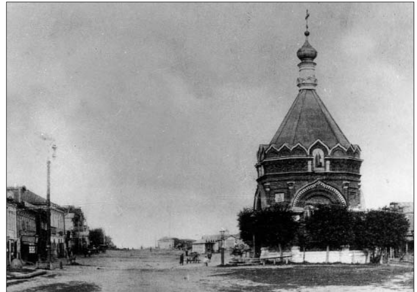
Александровская часовня на Торговой площади города Воскресенск. Открытка начала XX века.

С приходом советской власти часовня на Торговой площади попала в опись Вознесенской церкви: