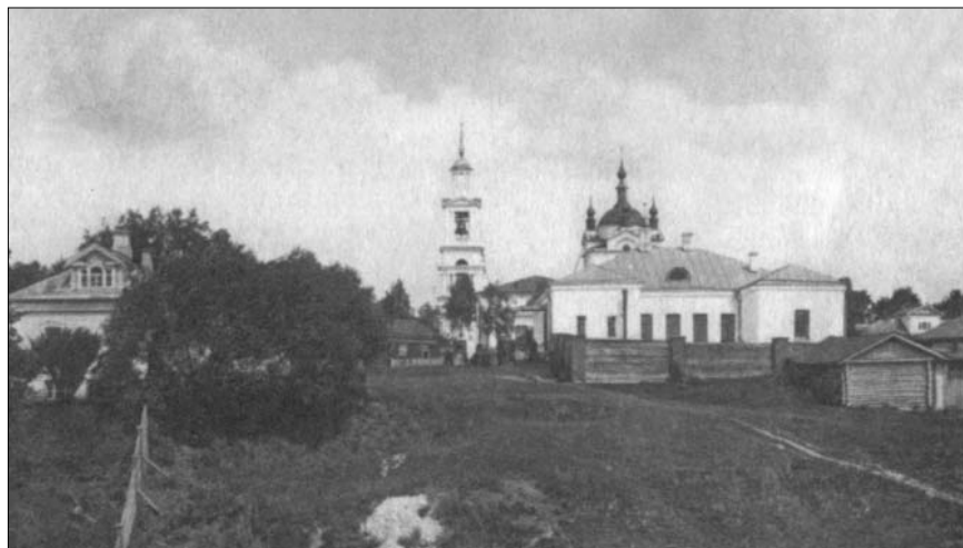
Церковь Вознесения Господня после расширения и здание управы города Воскресенска (на переднем плане). 1910-е годы. Из книги «У стен Нового Иерусалима».

По завершении строительства внутреннее про-