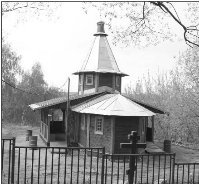
Деревянный Вознесенский храм-часовня в городе Истра. Современное фото.

приспособлений никаких не было, потому долго не могли осуществить задуманное. Но нашелся один смельчак, который с помощью веревок, крючков и других подсобных средств за большие по тем временам деньги сумел снять крест. Это было сенсацией