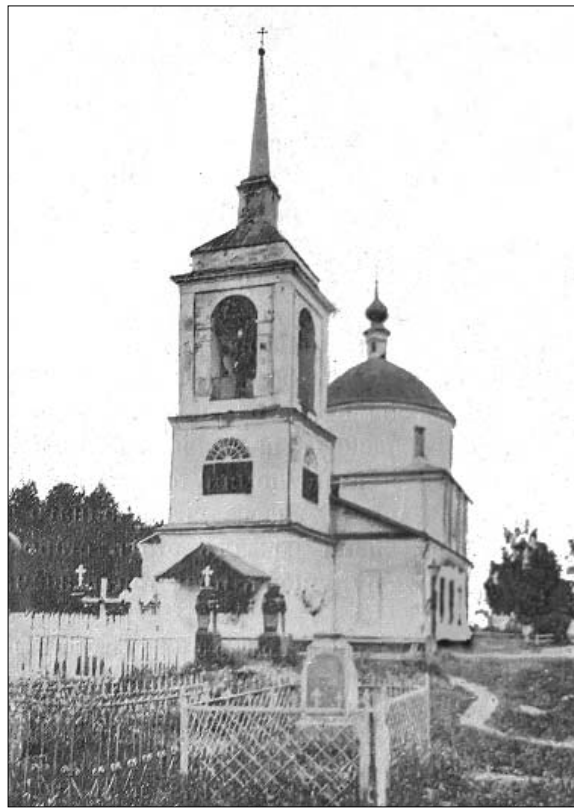
Храм Вознесения Господня в Воскресенске. Начало XX века. Из книги «Спутник по Московско-Виндавской железной дороге».

Какова судьба Воскресенской церкви? Существуют две версии. Первой придерживался церков-