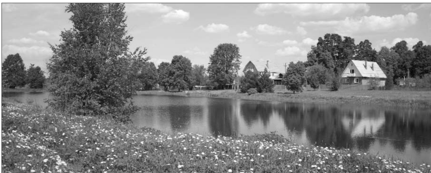
Пруд в деревне Хованское, на берегу которого находилась Знаменская церковь

И хотя сохранился до наших дней и пруд, и полуостров, о которых вспоминала дочь одного из последних владельцев Хованского, но место бывшей Знаменской церкви в конце прошлого века было продано под дачный участок. Сейчас на нем выстроен кирпичный дом, но, по словам старожилов, не на самом месте