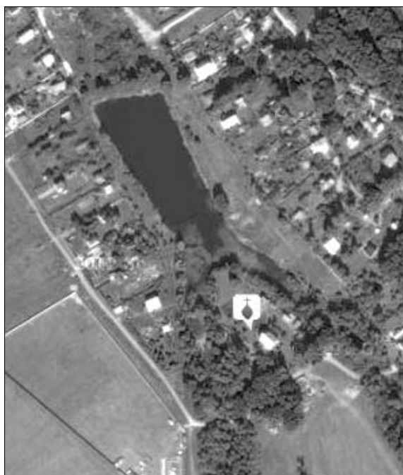
Спутниковый снимок с отметкой места бывшего храма