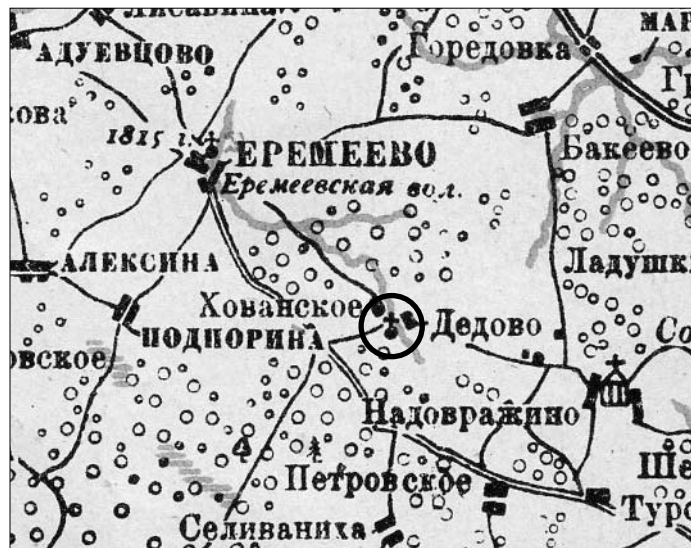
Отметка Знаменского храма на картах 1778 года (слева) и 1925 года

карнами, примыкали прямоугольные алтарь и притвор.