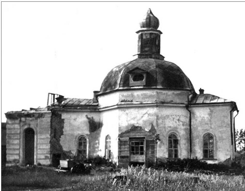
Церковь иконы Божией Матери «Знамение» в селе Хованское.